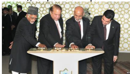
Церемонии открытия трубопровода ТАПИ совместно провели президент Туркменистана, Гурбангулы Бердымухамедов, президент Афганистана Ашраф Гани, премьер-министр Пакистана Наваз Шариф и заместитель президента Индии Хамид Ансари

Год 2015 был объявлен «Годом нейтралитета и мира» по постановлению Совета старейшин Туркменистана. Принятие уникальной резолюции Генеральной Ассамблеи Организации Объединенных Наций 12 декабря 1995 года стало признанием миролюбивой политики Туркменистана и его роли в качестве страны с возможностью внести большой вклад, проложить мирную тропу для развития международных отношений.