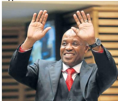
Премьер Восточного Кейпа, г-н Фумуло Масуале

Масуале коронован как лучший премьер сосредоточенный на гендерной политике Африки