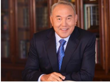
Президент Республики Казахстан, ЕП Нурсултан Назарбаев

1 декабря Казахстан празднует день первого президента. Посол Ш.М. Сони поздравил президента Нурсултана Назарбаева с Днем Первого Президента через Kaztube.kz.