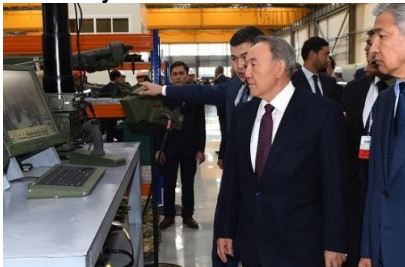
Президент Казахстана Нурсултан Назарбаев на открытии завода Paramount в Астане

Компания Paramount Group - крупнейший частный оборонный и аэрокосмический бизнес в Африке, объявила о стратегическом сотрудничестве с "Kazakhstan Engineering Distribution" для открытия завода в Казахстане по производству военных бронированных автомобилей и гражданских автобусов.