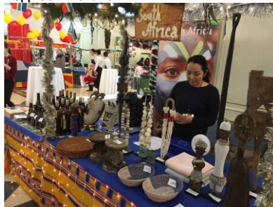
Торговая палатка Южноафриканского посольства в Астане на благотворительной ярмарке 2015 года.

В отеле Рэдиссон прошла седьмая ежегодная рождественская благотворительная ярмарка 6 декабря 2015 года. Все средства, вырученные на ярмарке пошли, на помощь обездоленным детям столицы.