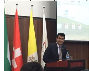
ЕП посол Шириш М. Сони в ходе своего выступления на тему смертной казни.

Управление международной тюремной реформы (PRI) в Центральной Азии совместно с посольствами Южной Африки, Европейской делегацией, Франции, Ватикана и Швейцарской Конфедерацией организовало семинар в КАЗГЮУ на тему смертной казни. Согласно программе главы миссий выступили