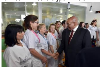
Президент Зума приветствует персонал в онкологическом центре в Лионе, Франция.

Президент Джейкоб Зума посетил город Лион, Франция, где он вместе с президентом Франции Олландом сопредседательствовал на официальном открытии Комиссии высокого уровня Организации Объединенных Наций по вопросам здравоохранения занятости и экономического роста (HLC HEEG). Лидеры двух стран были назначены Генеральным секретарем ООН в качестве сопредседателей комиссии высокого уровня ООН.