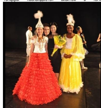
Девочки в национальных казахских костюмах