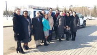
Дамы посольства, избалованные вниманием посла и советника