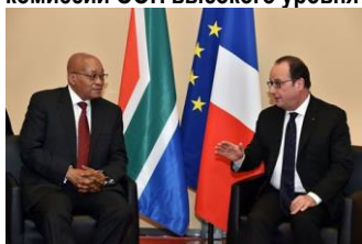
Президенты Джейкоб Зума и Франсуа Олланд

Президент Джейкоб Зума сопредседательствовал в комиссии ООН высокого уровня