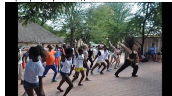
Мастер-класс от казахских учителей балета