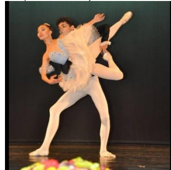
Выступление в столичном театре «Брейтенбах»