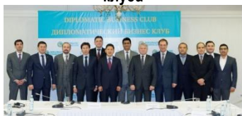
Послы иностранных государств и бизнесмены

В Астане прошло первое заседание Координационного совета Дипломатического бизнес клуба