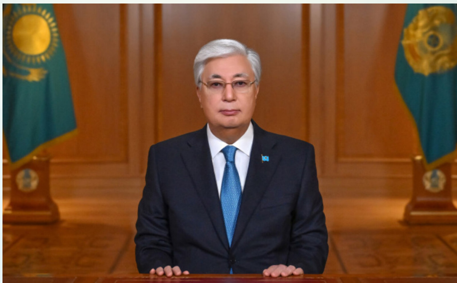
ТОҚАЕВ Қасым-Жомарт Кемелұлы, Қазақстан Республикасының Президенті

«Абай – төл мәдениетімізді дамытуға өлшеусіз үлес қосқан әлемдік деңгейдегі кемеңгер тұлға, халқымыздың сана-сезімін жаңғыртқан ұлы ақын. Ол жаңа әдебиетіміздің негізін қалап, дүниетанымымыздың көкжиегін кеңейтті. Өскелең ұрпақты білімпаз, еңбекқор, адал азамат болуға шақырып, ұлттың жаңа сапасын қалыптастыратын қасиеттерді кеңінен дәріптеді. Отанға деген сүйіспеншіліктің және ел мүддесі үшін қалтқысыз қызмет етудің озық үлгісін көрсетті.