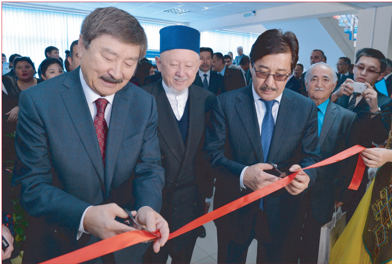
На факультете востоковедения КазНУ при поддержке международной организации «ТЮРКСОЙ» в рамках программы «Алматы – столица исламской культуры-2015» состоялась церемония открытия кафедры и культурного центра «ТЮРКСОЙ». Мероприятие было посвящено 20-й годовщине со дня основания Ассамблеи народа Казахстана.