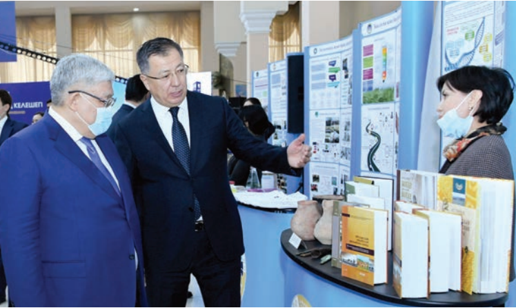
Соңы. Басы 1-бетте

Кездесуде Қырымбек Көшербаев Мемлекет басшысы Қасым-Жомарт Тоқаевтың креативті индустрияны дамыту мақсатында берген тапсырмасына сәйкес атқарылған жұмыстарға тоқталды. «Мемлекет басшысының тапсырмасына сәйкес, бұл бағытта алғашқы жұмыстар басталды. Үкімет креативті индустрияны дамыту бойынша жобалық кеңсе құрды. Қараша айында «2021-2025 жылдарға арналған креативті индустрияны дамыту тұжырымдамасы» қабылданды. Соған сәйкес, Нұр-Сұлтан, Алматы және Шымкент қалаларында бизнес-инкубаторлар, орталықтар мен хабтар құру қарастырылған. Алматы қаласында құрылатын бизнес-инкубаторға Әл-Фараби атындағы Қазақ ұлттық университеті негіз болуы керек деп есептеймін. Оған толық мүмкіндіктер бар. Жалпы, кез келген қоғамда креативті идеяларды тудыратын орта – жоғары оқу орындары мен ондағы энтузиаст жас ғалымдар. Бұл тұрғыда Әл-Фараби атындағы Қазақ ұлттық университеті қазақтың интеллектуалды тарихында бұрыннан көшбасшы», – деді Мемлекеттік хатшы.