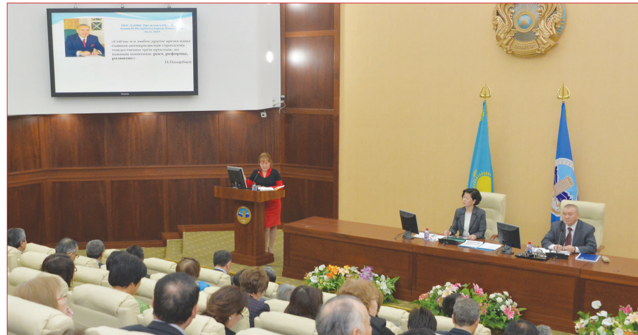
Послание Главы государства народу Казахстана обсудили на расширенном заседании Ученого совета КазНУ им. аль-Фараби. Как отметили ученые, преподаватели и студенты ведущего вуза страны, выступление Президента представляет собой важную антикризисную программу, являющуюся ключом к преодолению новых глобальных вызовов и дальнейшему динамичному развитию казахстанского общества.