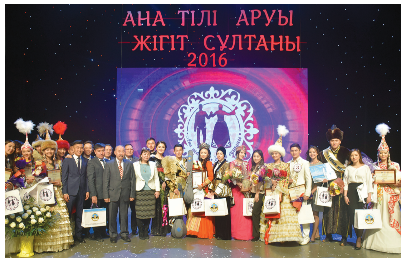
АНА ТІЛІ АРУЫ ЖІГІТ СҰЛТАНЫ 2016

Мақсаты анық, ұлттық бояуы қанық байқаудың актық сыны Ө. Жолдасбеков атындағы студенттер сарайында өтті. Университеттің 500-ге жуық қыз-жігіті байқауға қатысуға өтініш білдіріп, олардың ішінен елуі екінші кезенге іріктелініп алынды. Нәтижесінде сайыста 15 факультеттен келген 10 ару мен 10 сұлтан өз өнерлерін ортаға салды.