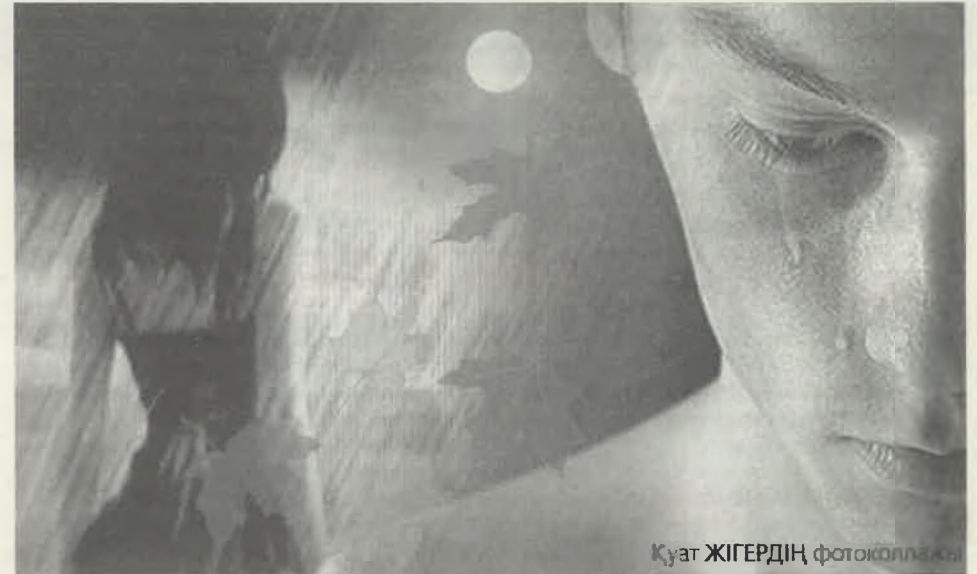
Қуат ЖІГЕРДІҢ фотожурналы

Пері қызын іздеп шықтым жолға мен, Сеңгір-сеңгір таулар асып сорлап ем.