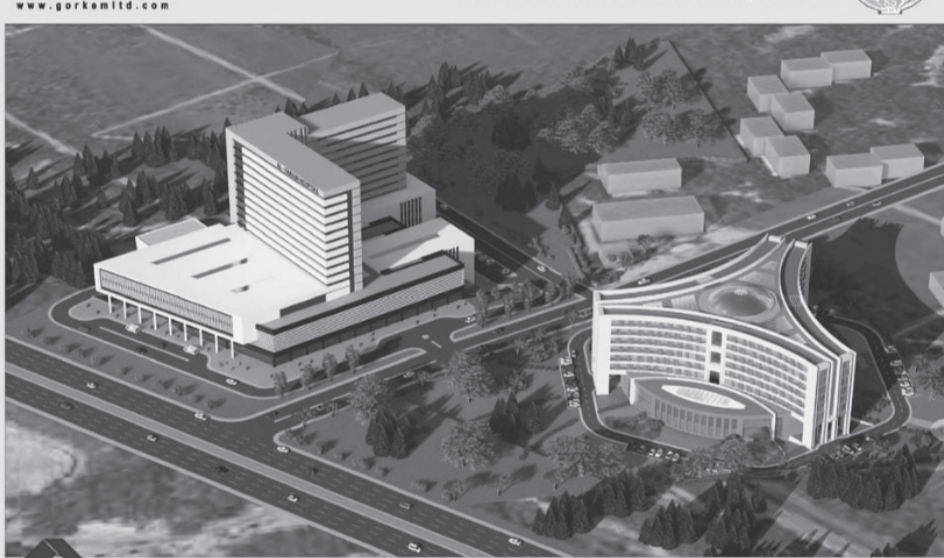
GORKEM CO. AL - FARABI HOSPITAL and TECHNOCITY COMPLEX

Фармация саласында кадрларды даярлауды жаңарту және оңтайландыру мақсатында «GxP Company» ЖШС базасында әл-Фараби атындағы ҚазҰУ-дың іргелі медицина кафедрасының филиалы құрылды.