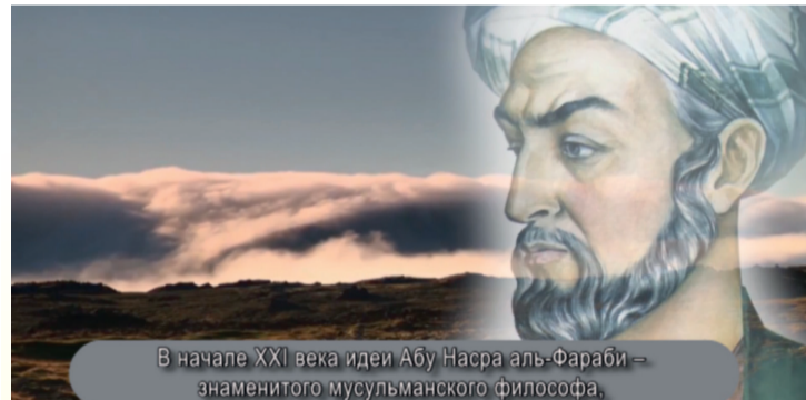
В начале XXI века идеи Абу Насра аль-Фараби – знаменитого мусульманского философа.

Университетте Елбасы Н.Ә. Назарбаевтың «Болашаққа бағдар: рухани жаңғыру» мақаласы аясында әл-Фараби атындағы ҚазҰУ, сондай-ақ университет жанындағы Телерадиокешені мен «Әл-Фараби» ғылыми-зерттеу орталығы қазақ және шетел фарабитанушы ғалымдардың қатысуымен түсірілген нидерландық деректі фильмді қазақ тіліне дубляждау жұмыстарын бастап кетті.