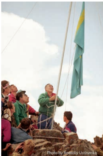
Н. Назарбаев «Абай» шыңында

шілдігі күнінде мұнда боранға тап болсаңыз, тіпті таңданбаңыз. Тау табиғаты сондай. Үскірік жел, шұғыл бұлттану, жаңбыр мен қар, найзағай – бәрі-бәрі мұнда жылдам. Ал шыңның ұшар басына шыққанда бұлттар да төменде қалады. Жетінші аспан көкжиегі ашылғандай әсер баурап алады. Бейне бір әлемнің күмбезінде отырғандай сезінесіз. Тек оны сөзбен айтып жеткізу мүмкін емес. Шығып, көзбен көріп, сезіну керек. Міне, сонда ғана жаратылыстың тағы бір ғажайыбына куә болып, шың рухынан рухтанасыз хәм биікке құштар боласыз.