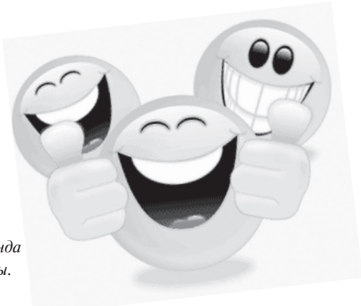
Күндердің күнінде студент бір жаққа қатты асығып бара жатады.