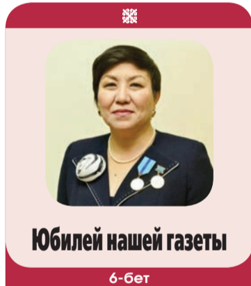
Юбилей нашей газеты