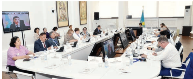
Соңы. Басы 1-бетте

Сондықтан мен білім мәселесіне ерекше мән беремін» деген сөзін тілге тиек етті.