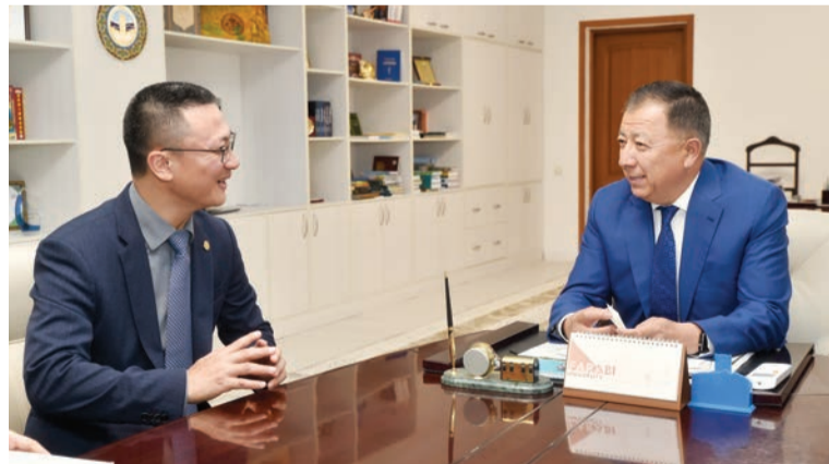
Соңы. Басы 1-бетте

Өз сөзінде ректор ҚазҰУ Huawei компаниясымен серіктестікті одан әрі дамытуға ниетті екенін жеткізді.