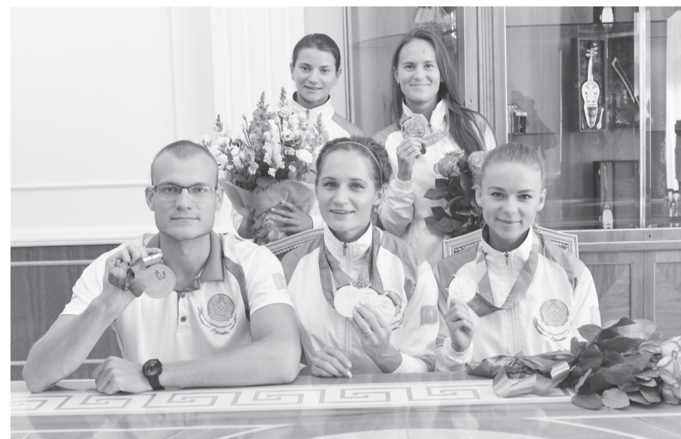
ҚазҰУ – халықаралық спорт аренасында Қазақстан беделін асқақтатқан ерен жүйрік спортшылар тобын тәрбиелеп отырған ЖОО-ның бірі. Оған дәлел – университет студенттерінің Кванджу қаласында (Оңт.Корея) өткен жазғы Бүкіләлемдік универсиададан бес алтын медальмен оралуы.

Аталған сайыстың қорытындысы бойынша, құрама коржынында алты алтын медаль бар. Бұл біздің еліміздің жазғы универсиадаға қатысу тарихында рекордтық көрсеткіші болып табылады. Осы байқауда Қазақстан құрамасы