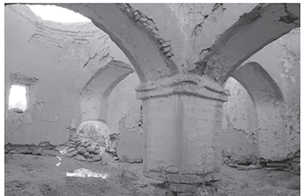
Досжан Қашақұлы салдырған Қайнардағы мешіттің ішкі ұстыны

Мешіт құдығымен бірге «Қайнар діни-тұрмыстық кешені XVIII - XX ғғ»