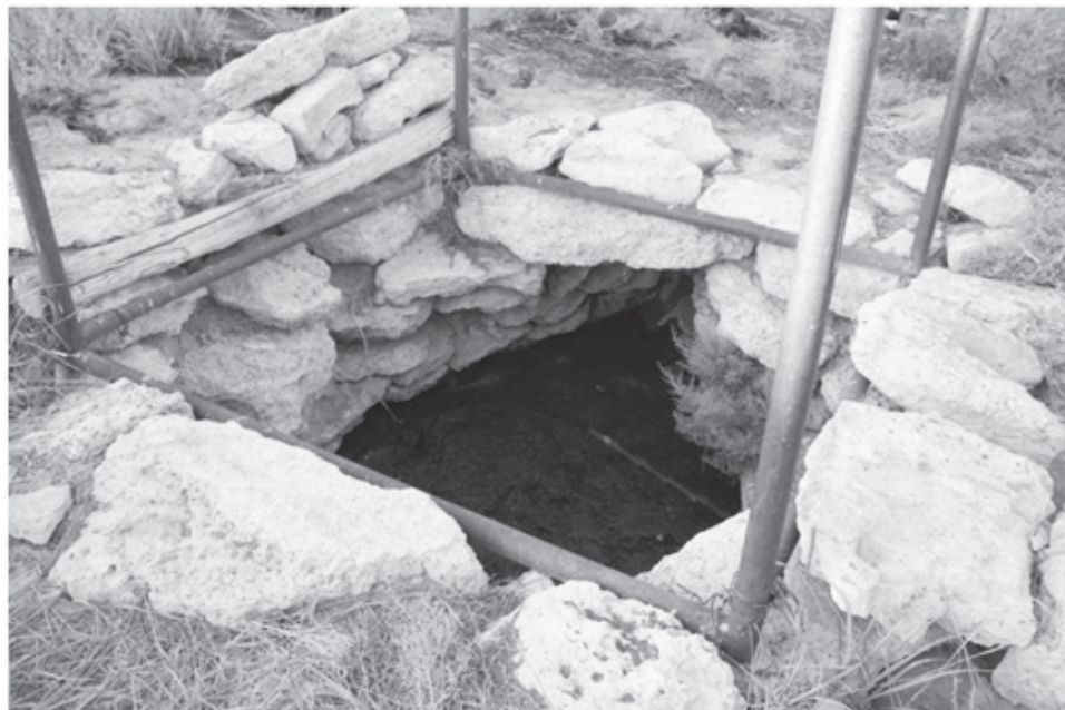
Досжан Хазіреттің Қайнардағы мешітінің құдығының жалты көрінісі

Экспедиция мүшелері Досжан Ишан мешіт - медресесінің бұзылудан қалған бөлігін консервациялау жұмысымен және Досжан Қашақұлының қабірі үстінен тұрғызылып жатырған кесене құрылысымен танысты. Ескерткіштің қазіргі жай күйін, бұзылу қаупін