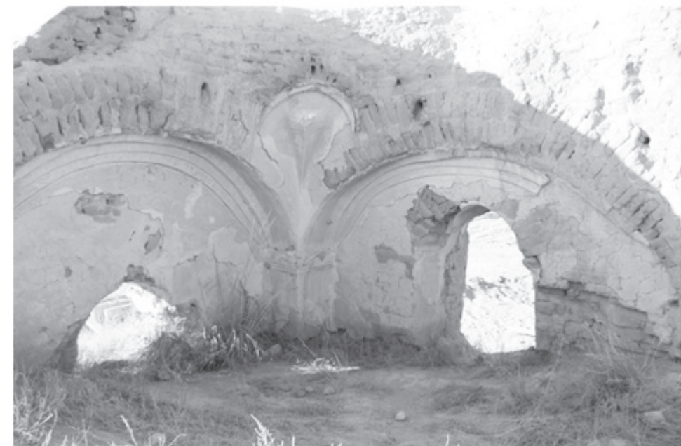
Досжан Қашақұлының Шұбарқұдықтағы мешітінің ішкі қабырғасының сақталған бөлігі

археология, этнология және музееология кафедрасының профессоры