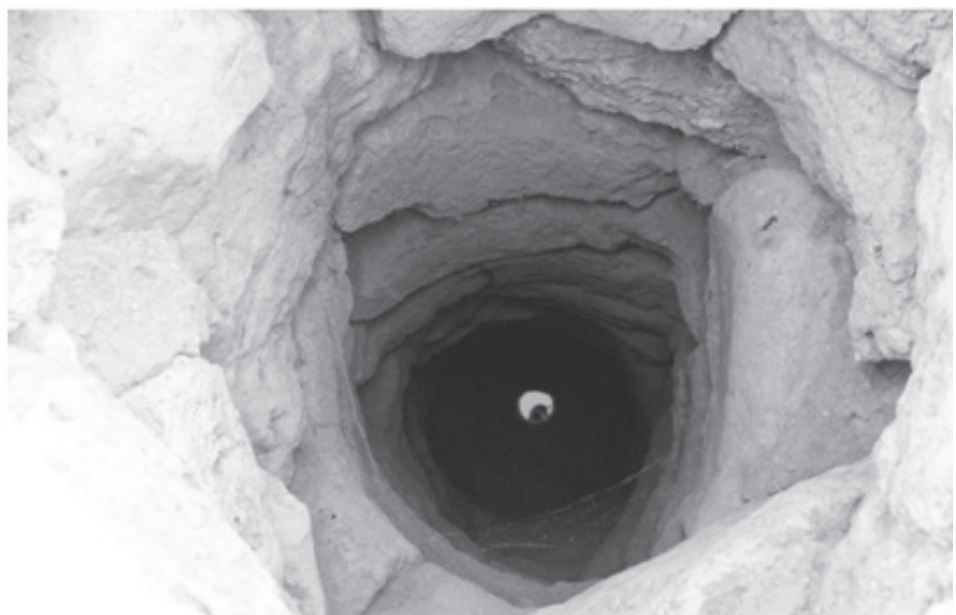
Тасастау шыңырауының ішкі шегені

ҚазҰУ-да «AVEVA химия-технологиялық үдерістерін инженерлік жобалау орталығының» ресми ашылуы болады