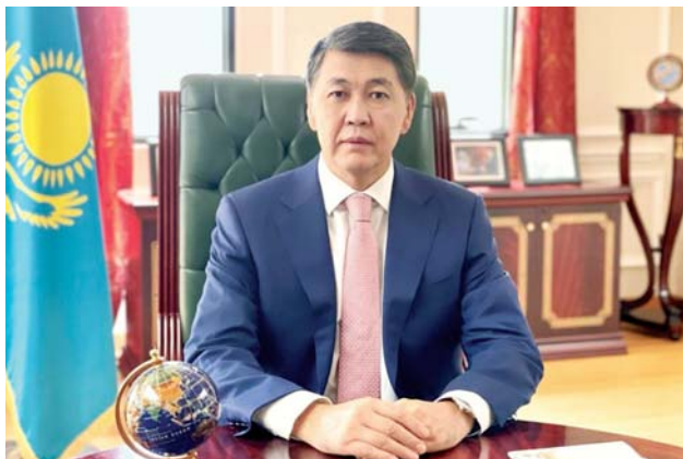
Берік АРЫН, ҚР-ның Сауд Арабиясындағы төтенше және өкілетті елшісі, Ислам ынтымақтастығы ұйымы жанындағы тұрақты өкілі

Кез келген оқу орнының атын шығарып, беделін өсіретін – оның дарынды, білімді түлектері. Әл-Фараби атындағы ҚазҰУ-дың Түлектер қауымдастығы жыл сайын дәстүрлі Түлектер күнін ұйымдастырады. Университет қабырғасында білім алып, шартарапқа тараған түлектері 50, 40, 30, 20 жылдық кездесулерін жыл сайын осы қарашақырақта атап өтеді. Биылғы Түлектер күні Қазақстан Республикасы Тәуелсіздігінің 30 жылдығы аясында өткізіліп жатыр. Әл-Фараби атындағы ҚазҰУ-дың Түлектер қауымдастығы Қазақстанда бірінші болып құрылды. Ол бүкіл әлемді біріктіреді. Олай дейтін себебіміз – бұл оқу орнында оқыған шетелдік азаматтарды былай қойғанда, ҚазҰУ-дың қаншама түлектері өзге мемлекеттерде Қазақстанның мүддесіне қызмет етіп жүр. Түлектер күні қарсаңында Әл-Фараби атындағы Қазақ ұлттық университетінің Басқарма Төрағасы – Ректоры Жансейіт Түймебаевтың атына жолданған көптеген құттықтаулар келуде.