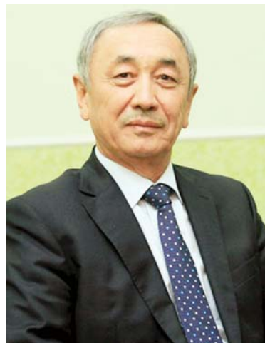
Мейрамбек ТӨЛЕПБЕРГЕН, Қазақстан Республикасы Парламенті Мәжілісінің депутаты

академиялық институттарының біріне айналды. Ардақты профессорлар және құрметті оқытушылар қауымы, ҚазҰУ-дың халықаралық білім, ғылым және мәдениет орталығы ретіндегі дамуы, оның халықаралық білім беру кеңістігіндегі рөлі, мәртебесі мен рейтингі бұдан былай да арта берсін! Университеттің ғылыми әрі білім беру қызметін жаңашыл әдістері арқылы сапалы көкжиектерге қол жеткізу үшін көмек көрсетуге, оның халықаралық серіктестерімен қарым-қатынастарын нығайтуға және қоғамымызда ҚазҰУ-дың жоғары құндылықтарын тарату үдерісіне белсене атсалысуға ниеттіміз. Студенттерге терең әрі сапалы білім, сондай-ақ нағыз ұлттық тәлім-тәрбие берудегі ерен еңбектеріңіз, зор қызметтеріңіз әрқашан да жемісті болғай! Алар асуларыңыз, бағындырар белестеріңіз әрдайым биік болсын деп тілейміз. Дәстүрлі Түлектер күні құтты болсын!