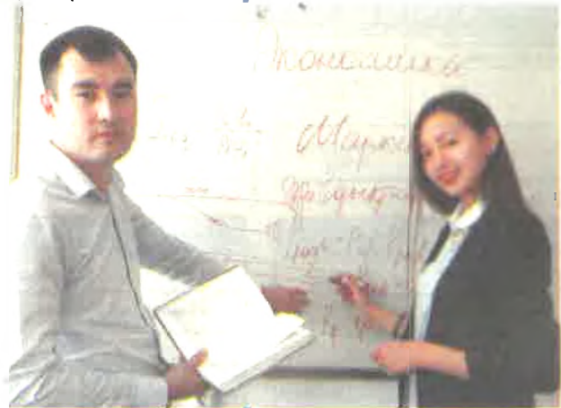
Менеджмента – Франция), в магистратуре – с Российским Университетом Дружбы Народов и Новосибирским государственным университетом (Россия).

6D050600 – Экономика 6D050700 – Менеджмент 6D051700 – Инновациялық менеджмент 6D050800 – Есеп және аудит 6D051800 – Жобаларды басқару 6D050900 – Қаржы 6D051000 – Мемлекеттік және жергілікті басқару 6D090900 – Логистика