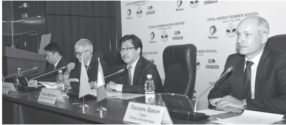
Орталық екі достас елдердің университеттері арасындағы әріптестік пен қос дипломдық бағдарламаның көпірі болып саналады. Оның негізгі

ҚазҰУ жанындағы «Геоэнергетика» орталығы Қазақстан мен Франция Президенттерінің қолдауымен 2010 жылдың маусым айында құрылған.