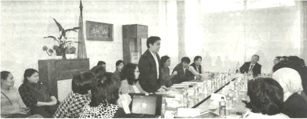
Кафедра эпидемиологии и гигиены медицинского факультета (ВШОЗ) КазНУ в рамках международной научной конференции студентов и молодых ученых «Фараби әлемі», которая недавно прошла в стенах ведущего университета Казахстана, продолжает внедрять идеи философии Аль-Фараби по формированию профилактического подхода к проблеме укрепления здоровья отдельных людей и общества.