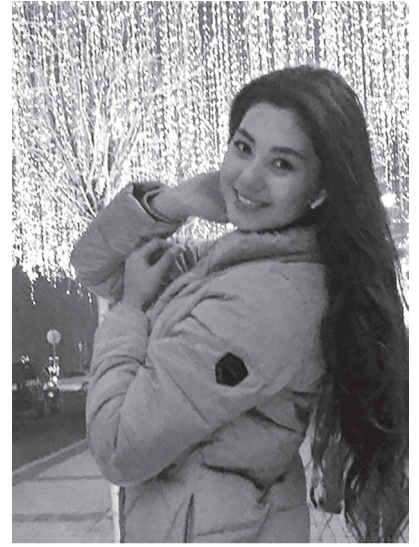
Фарабиім шарықтасын күлімдеп Ұрпағына қарамасын өкпемен! О туған жер, қандай ыстық кең едің, Шалқып әндер жайқалады көп егін Ұлы жерде ұлы достық үйлессе Фарабидің ақ арманы дер едім!

Түркістанның арайланған ақ таңы, Бұлбұл үні естіледі бақтағы. Мәдениеттің өркендеген өр шыңын, Бекер емес Отырдан тапқаны. Тарих өтті жолдайын шаңы ұзаған, Өз күйін шертті тағы қобыз ақ далам. Мықты қадам басын деп болашаққа Сыйлады Әл-Фарабидей ойшыл адам! Әл-Фараби құнды еңбекпен естесің, Халқың сенің қара түнек кешпесін. Ғасырларға бақыт нұрын себетін Әсем үнің, бар мағынаң өшпесін! Әр заманда әр мағына, әр ұғым, Фарабидің сырын ұққан жарлының. Ұлы жерде ұлы достық үйлессе, Әл-Фарабидің туысысың барлығың! Жалған өмір кімдер сенен өтпеген, Уа қара жер, кімдер саған жетпеген?