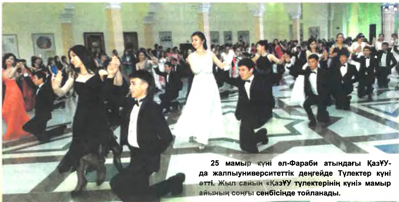
25 мамыр күні әл-Фараби атындағы ҚазҰУ-да жалпыуниверситеттік деңгейде Түлектер күні өтті. Жыл сайын «ҚазҰУ түлектерінің күні» мамыр айының соңғы сенбісінде тойланады.