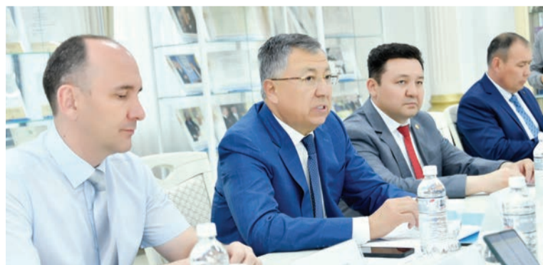
Соңы. Басы 1-бетте

Samsung Electronics тапсырысы бойынша 2015 жылдан бастап ҚазҰУ оқытушылары мобильді қосымшаларды, интернет құрылғылардың технологияларын әзірлеу, машиналық оқыту курстарын даярлап, енгізді.