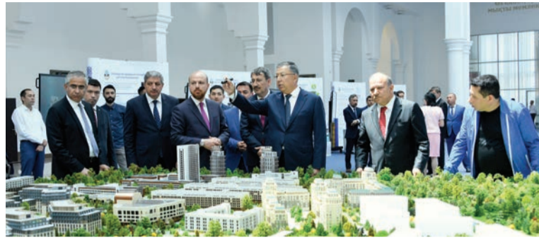
Соңы. Басы 1-бетте

Алдағы уақытта қос университет арасындағы ортақ инновациялық жобалар сәтті жүзеге асады деген үміттемін», – деді Нежмеддин Біләл Ердоған.