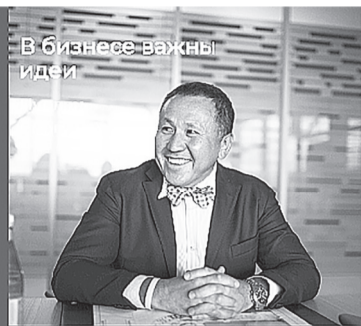
В бизнесе важны идеи