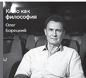
Кино как философия Олег Борецкий