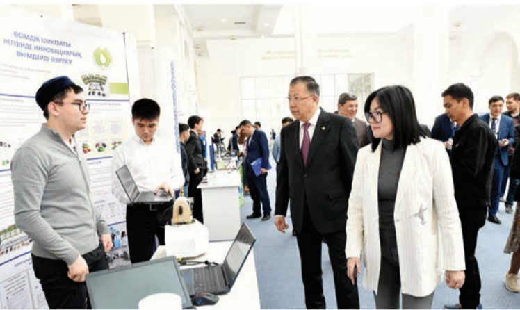
Соңы. Басы 1-бетте

Қатысушылардың пікірінше, конференция ІТ саласында елімізде жұмыс істейтін компанияларды жандандыруға, кәсіби дағдыларды дамытуға және өз мүмкіндіктерін көрсетуге жаңа серпін береді.