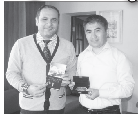
Осындай айтулы күнді Алматы қаласындағы Мысыр Араб