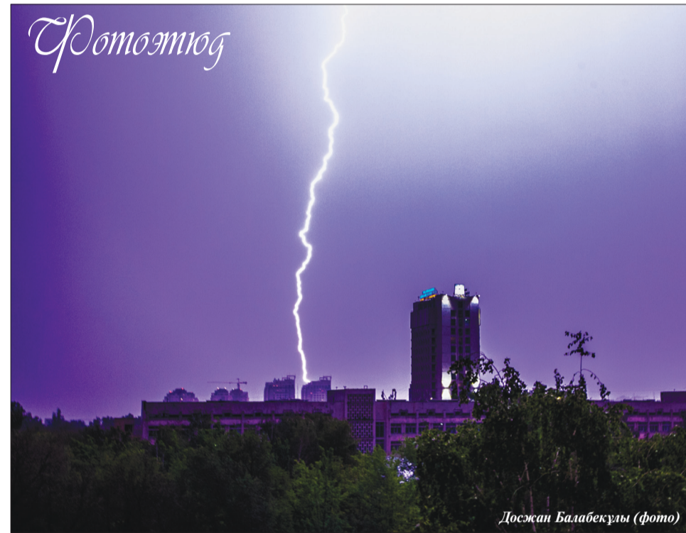
Досжан Балабекулы (фото)