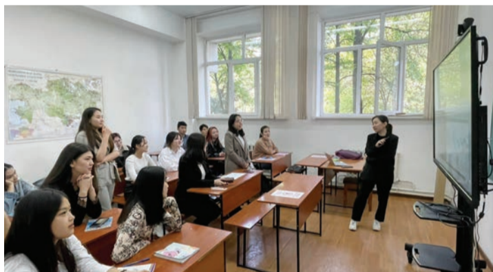
«География (2-топ)» мамандығымен бірге өткізілген тәрбие сағатынан

Қазіргі асығыс заманда көбіміз ұйқыны демалыс емес, қажеттілік деп санаймыз. Нәтижесінде ұйқыға салғырт қарап, оның сапасын әлдеқайда төмендетеміз. Ұйқының уақыты, орны, ұзақтығы сынды қасиеттері сақталған жағдайда ғана түнгі ұйқы сіз үшін нағыз демалыс бола алады. Алайда кейде тәулігіне 9-11 сағат ұйықтасақ та, ұйқымыз қанбай, шаршаңқы болып тұрамыз. Неге? Бұл жерде «сапалы ұйқы» деген түсінікке назар аударғанымыз жөн.