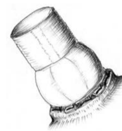
3-сурет. Түйіндерді байлау кезеңі аяқталғаннан кейінгі көрініс. Бұл техника тігіс арасындағы қан кетуден сақтайды. Қан жоғалту күрт төмендейді, фистулалар мен тромбтар (протез панусы) пайда болмайды