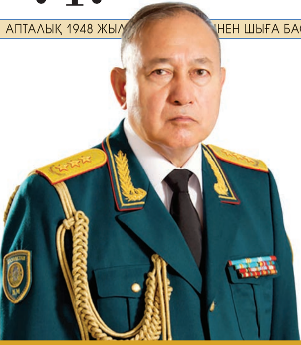
Сәт ТОҚПАҚБАЕВ, генерал-полковник: