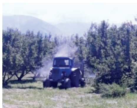
«Бахус Глобал» ЖШС бақтарының аумағында құрамында күкірт бар препаратпен алма ағаштарын өңдеу барысы