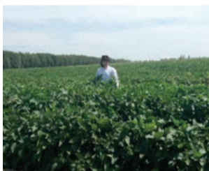
«Амиран» Қазақ тағамтану академиясының зауыты ЖШС соя алқаптары

діктерде зиянды микроорганизмдердің көбеюі бәсеңдейді.