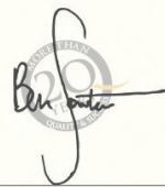
Ben Sawyer - Head of QS Intelligence Unit

QS Stars™ - © 2020 QS Intelligence Unit is a division of QS Quacquarelli Symonds Ltd. INTELLIGENCEUNIT