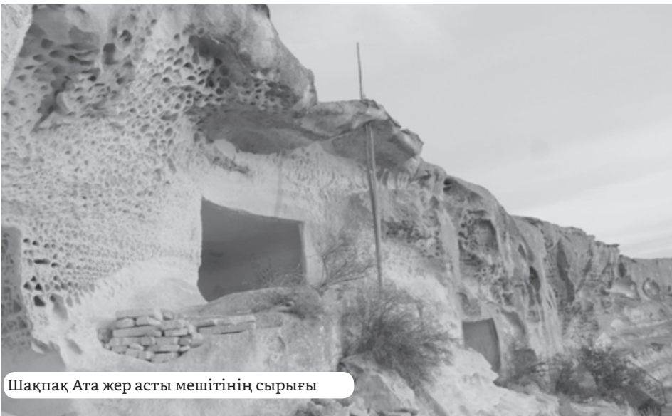
Шақпақ Ата жер асты мешітінің сырығы

Археология, этнология және музеология кафедрасының профессоры