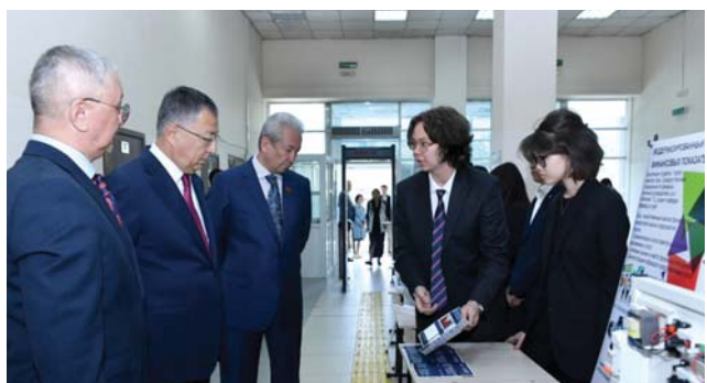
Соңы. Басы 1-бетте

Салтанатты рәсімге қатысушылар алдымен Студенттік бизнес-инкубаторлардың инновациялық жобалары көрмесімен танысты.