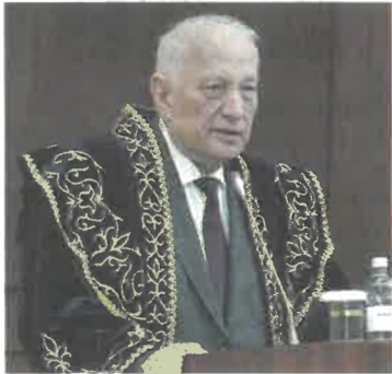
Мұрат ЖҰРЫНОВ, ҚР ҰҒА президенті:

Әл-Фараби атындағы Қазақ ұлттық университетінде Ұлыстың ұлы күніне арналған «Жаңа Қазақстан: ұлтты ұйыстыратын құндылықтар» мерекелік бағдарламасы бойынша өткізілген іс-шараларға белгілі мемлекет және қоғам қайраткерлері, ғалымдар, факультет ардагерлері, ҚазҰУ оқытушылары мен студенттері қатысты. Мерекелік жиынға келген қонақтардан Наурыз мерекесінің жаңа форматта өткізілуі жөнінде ой-пікірлерін білген болатынбыз.