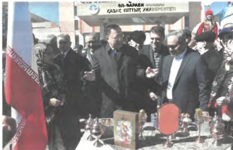
Соңы. Басы 1-бетте

Арнайы шақырылған қонақтар қатарында Түркітілдес елдер Парламенттік Ассамблеясы, шетелдік дипломатиялық корпус өкілдері мен консулдар, ғылыми-шығармашылық қауым, суретшілер мен БАҚ өкілдері бар.