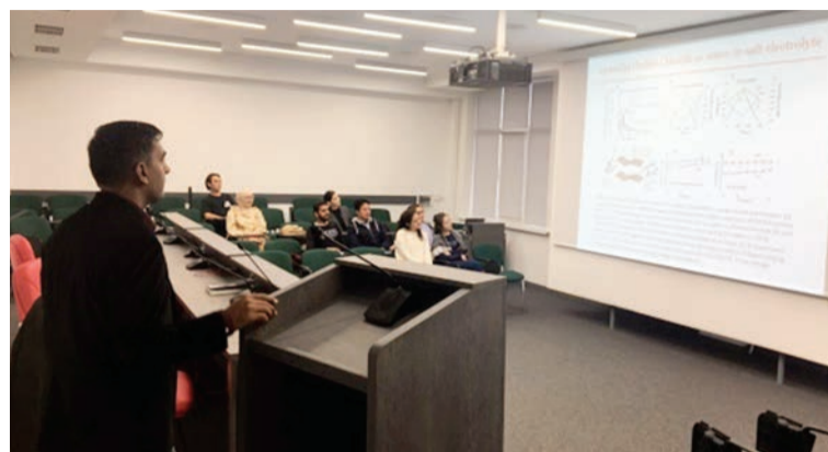
During lecture and visit of research center