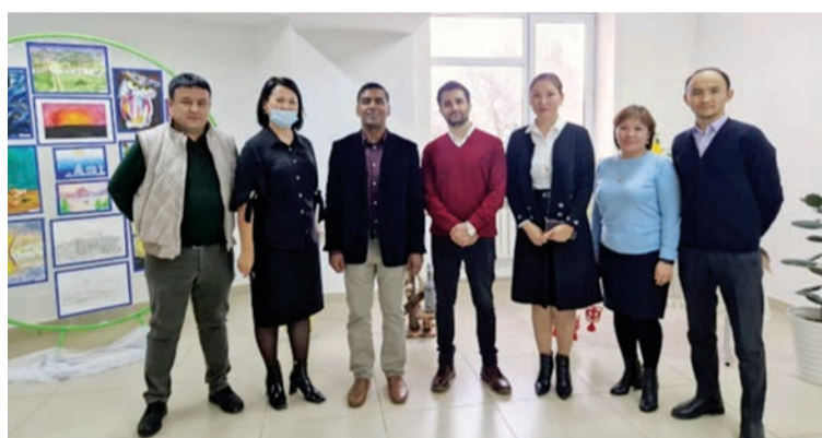
During lecture and visit of research center

These interesting topics and the scientific content of these lectures attracted great attention of students and young scientists to