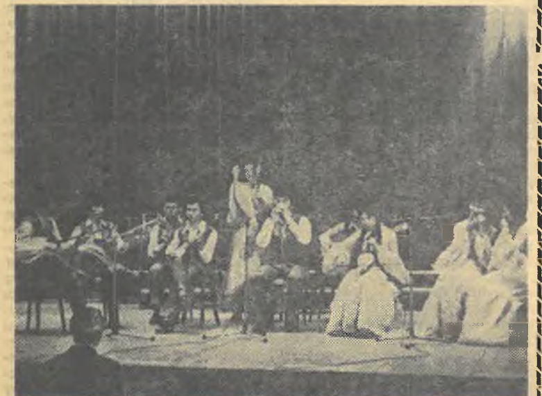
На снимке: Выступает оркестр казахских народных инструментов.