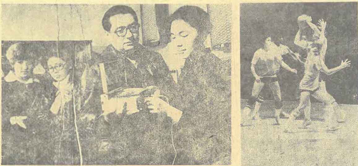
Студенты в аудитории и на спортивной площадке.