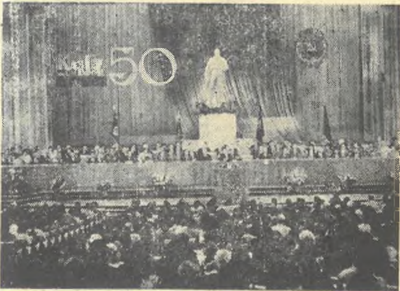
На снимке: Дворец имени В. И. Ленина. Торжественное собрание, посвященное юбилею университета.

Коллектив Казахского государственного университета заверил, что отдаст все свои знания, опыт и энергию борьбе за великое дело ленинской партии, успешно выполнит задачи, выдвинутые XXVI съездом партии, последующими Пленумами ЦК КПСС, XV съездом Компартии Казахстана.