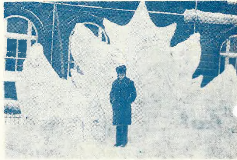
Кленовый лист — национальная эмблема Канады.

Большое впечатление на нас произвела знаменитая церковь Нотр-Дам, построенная в готическом стиле. Здесь установлен орган, который состоит из 6 тысяч труб, часто выступают самые известные музыканты.