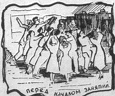
перед началом занятий.