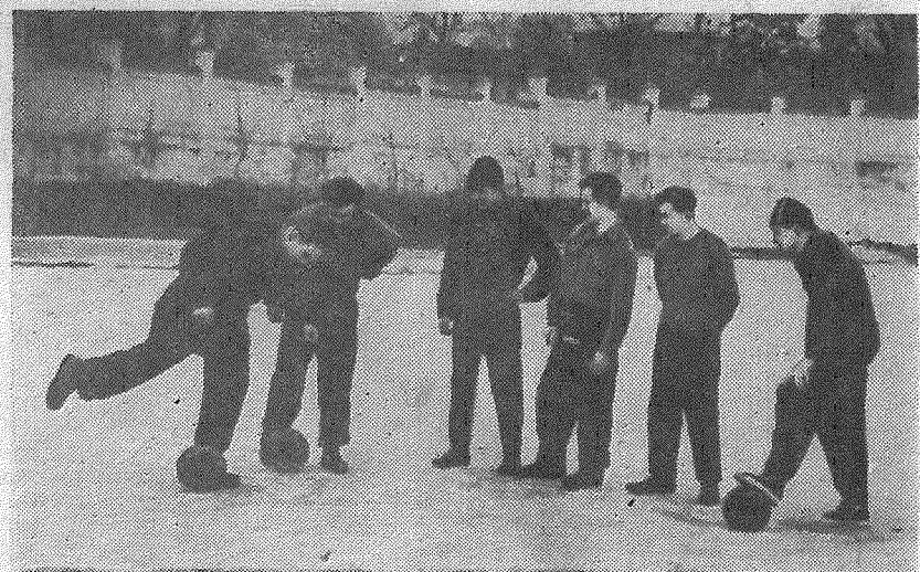
Скоро первое состязание на футбольном поле. К нему усиленно готовятся наши спортсмены.