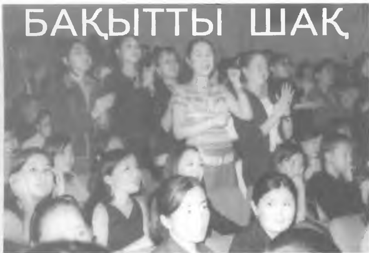
Соңы. Басы 1-бетте.

Ант қабылдау рәсімінен кейін студенттердің әнұраны «Гаудеамус» орындалып, арты мерекелік концертке ұласты. Атап өтерлік бір жайт, бас қосудың бірінші күнінде гуманитарлық факультеттің студенттері, екінші күнінде жаратылыстану факультетінің студенттері қатынасып, өздеріне арналған жылы лебіздерді тыңдап, концерттік қойылымдарды тамашалаған еді.