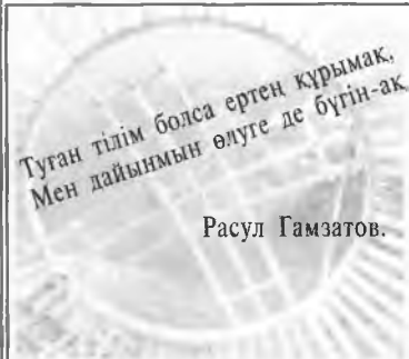
Туған тілім болса ертең құрымақ, Мен дайынмын өтуге де бүгін-ақ Расул Гамзатов.

әл-Фараби атындағы Қазақ ұлттық университетінде 2002 жылдың қыркүйек айының 16-22 жұлдыздары аралығында “Қазақстан халықтарының тілдері мерекесіне” орай ұйымдастырылған апталық болып өтті.