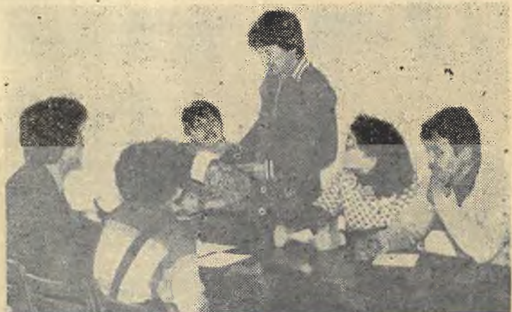
На снимке: на заседании комитета комсомола факультета.

М. ЖАҚЫПОВ, «Қазақ университеті» газетінің арнаулы тілшісі.