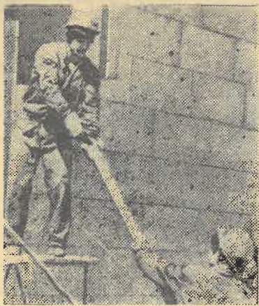
На снимке: бойцы ССО «Кировец-82» на стройке КазГУграда.

В координации усилий всех субподрядных организаций в вопросах эффективного использования ССО играет роль и ежедневная летучка старших прора-