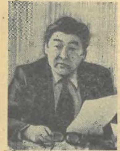
Суретте: М. Қ. Қозыбаев.

Алғашқы кездесу университеттің тарих факультетінің түлегі, бүгінгі Қазақ Совет энциклопедиясының бас редакторы Манаш Қабаш ұлы Қозыбаевпен болмақ.