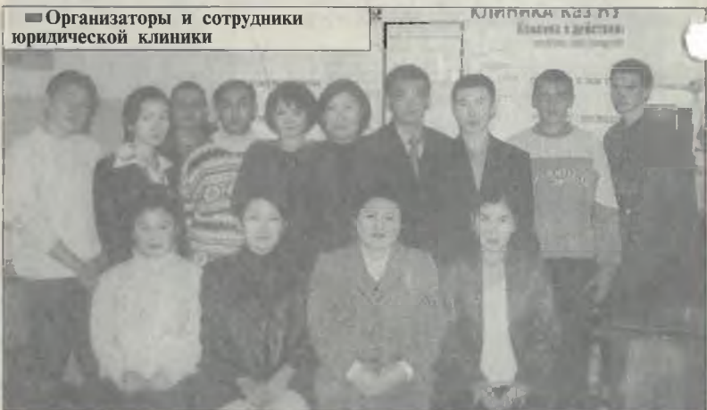
Организаторы и сотрудники юридической клиники

В западных вузах студенты дают консультации по