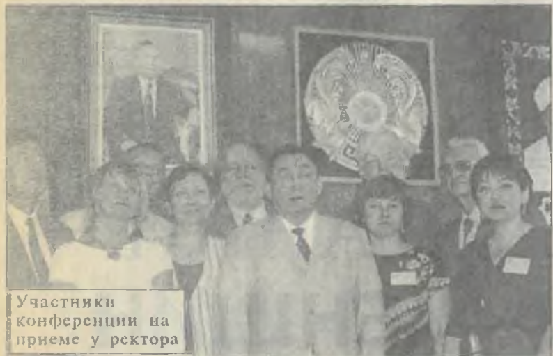
Участники конференции на приеме у ректора