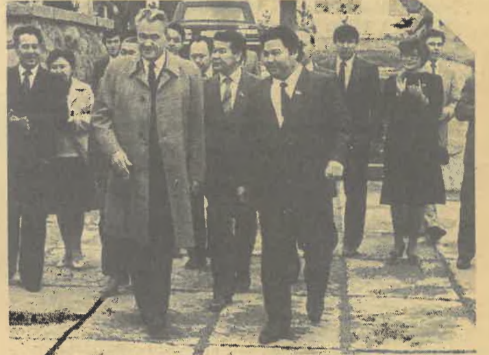
НА СНИМКЕ: во время посещения строящегося комплекса КазГУграда членом Политбюро ЦК КПСС, первым секретарем ЦК Компартии Казахстана тов. Д. А. Кунаевым.