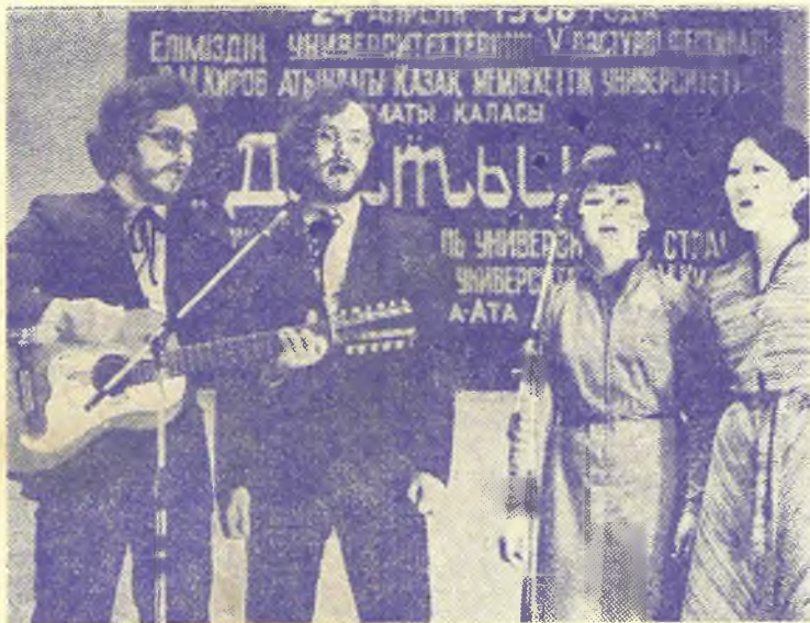
На снимках: «Петь — значит бороться!»