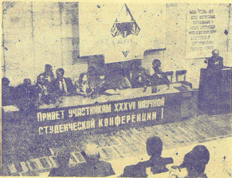
На снимке: открытие XXXVII студенческой научной конференции.