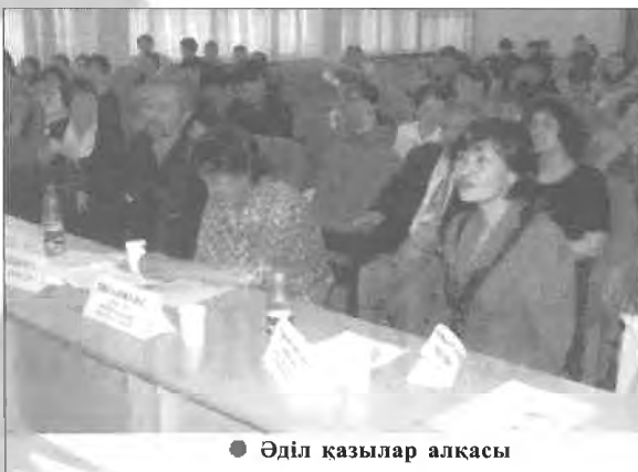
● Әділ қазылар алқасы

Сіздердің назарларыңызға 2003 жылдың 29 мамыры күні өткізілген жыр бәйгесінің қорытынды III турында жүлделі орындарды жеңіп алған кейбір