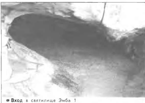
● Вход в святилище Эмба 1

Приазовье. Этот уникальный памятник по своему топографическому положению близок к святилищам Эмбы 1,2. Имеется определенное сходство и по отдельным изображениям и композициям, в