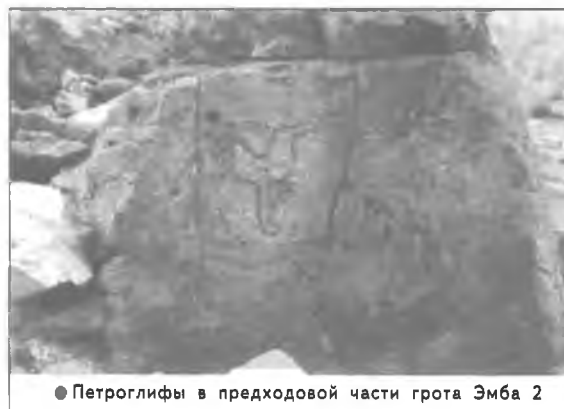
● Петроглифы в предходовой части грота Эмба 2

Техника выполнения рисунков – резная с последующей пришлифовкой некоторых наиболее углубленных фигур. Рисунки выполнены в одном стиле. И хотя среди изображений наблюдается случай палимесе, возникает ощущение гомогенности изобразительного комплекса в целом. Если считать, что верх композиции находится в верхней части пола, наклоненного к входу, то можно выделить три зоны, примерно равных по площади и объединенных одними и теми же изображениями. И так, верхнюю часть занимают ряды резных линий параллельного и субпараллельного характера, иногда они пересекаются горизон-