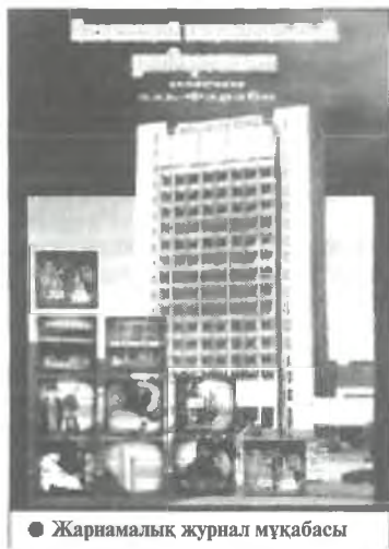
Жарнамалық журнал мұқабасы