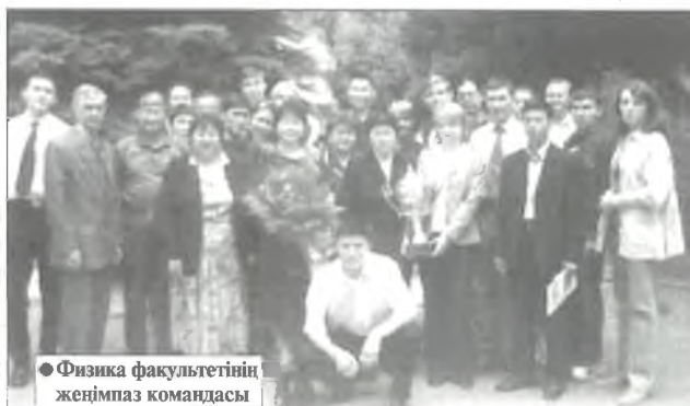
Физика факультетінің жеңімпаз командасы

- Иә, қызметкерлердің балаларына, Қаскелендегі жетім балалар үйіне қолымыздан кел-