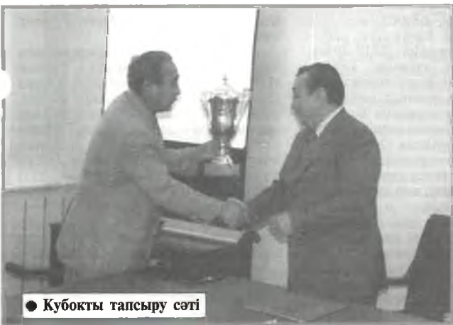
Кубокты тапсыру сәті

Спорт - тіршіліктің жаны. Себебі, тіршілік пен күнделікті қам-қарекетіміздің, отбасы-ошақ қасындағы, қоғамдық орындардағы жұмысымыздың негізі денсаулыққа келіп тіреледі. Тіпті, ақыл-ой еңбегін қажет ететін жұмыстардың өзін мықты денсаулықсыз ойдағыдай орындап, жүзеге асыру мүмкін емес. Демек, денсаулық - өмір тірегі. Ал, денсаулықтың мықты болып, жақсаруы - адамның өз қолында. Оның кілті - спорт. Сондықтан да спортты тіршіліктің жаны, денсаулықты жақсартудың кілті деп тегін атамаймыз.