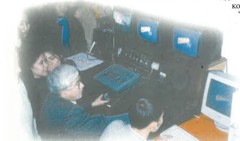
Журналистика факультетінің телестудиясы

Журналистика ісі - тек эстрада не спорт жұлдыздарынан сұхбат алумен