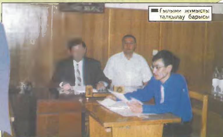
Ғылыми жұмысты талқылау барысы

Философия - мать наук. Она обобщает весь комплекс знаний любой эпохи и любого общества.