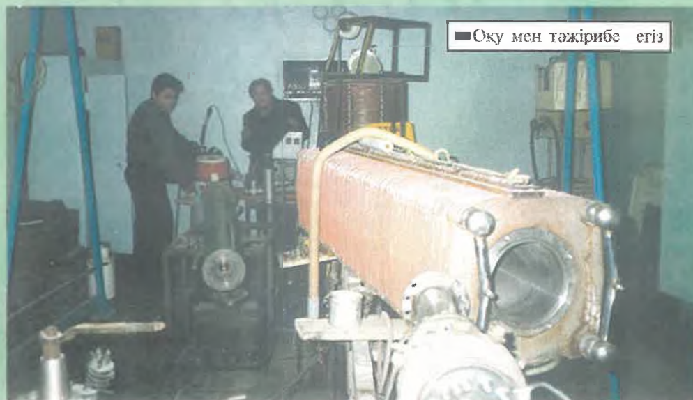
Оқу мен тәжірибе егіз

Химия изучает первокирпичики всех материальных тел, их причинные связи и взаимодействия. Химик не только изучает, но и создает новые вещества, новые элементы.