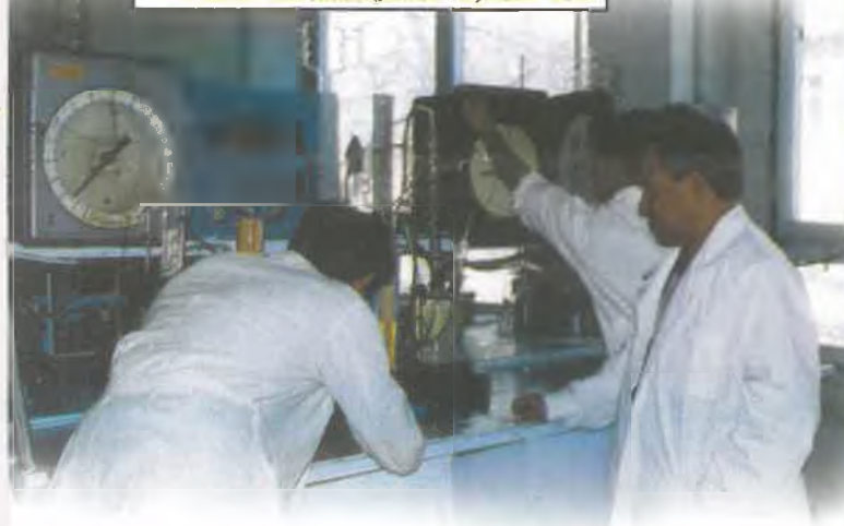
Физик мамандардың жұмыс сәті

Егер болашағыңды ойласаң, физика факультетіне оқуға кел!