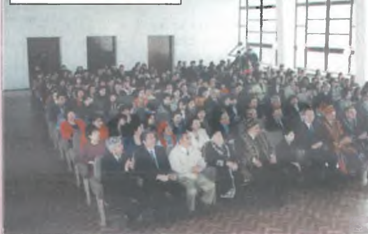
Мехматтың акт залы

Математика - это универсальный язык, это язык, который предоставляет нам возможность вступать в контакт с миром, с другими людьми, с природой.