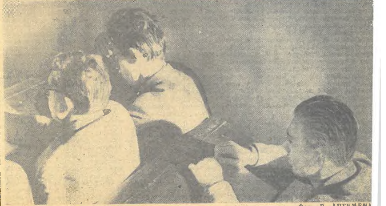
Кто-то из них сейчас выступит.