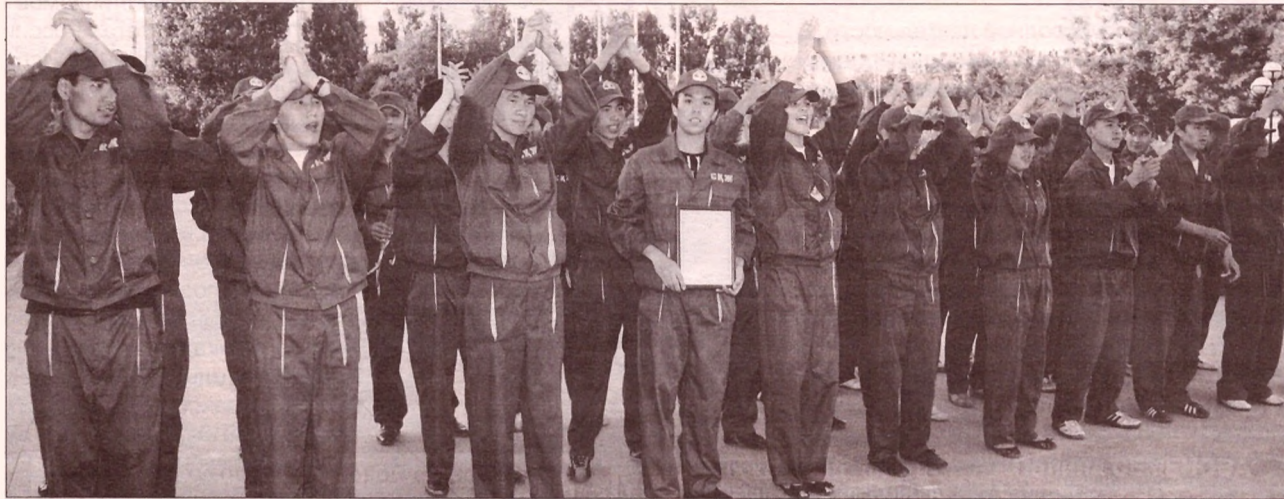
(Соңы. Басы 1-бетте)

Ал 1973 жылы ҚазҰУ қалашығында комсомолдық құрылыс жарияланды. Ендеше, қалашығымыздың көркеюі қашан да студенттік күш-жігердің арқасы екенін ұмытпауымыз керек.