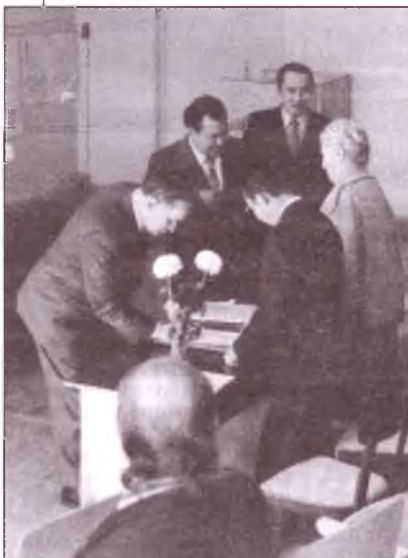
1975 г. Защита докторской диссертации в КазГУ

Кем быть? Какую дорогу выбрать? Хорошо, если эти вопросы вы решали уже с самых первых лет учебы, здраво оценивая свои способности, получая азы профессии. Наверное, любой человек на всю жизнь запоминает день, когда он впервые был полностью ответственным за свое дело. Такой день — шаг вперед, новая ступень,