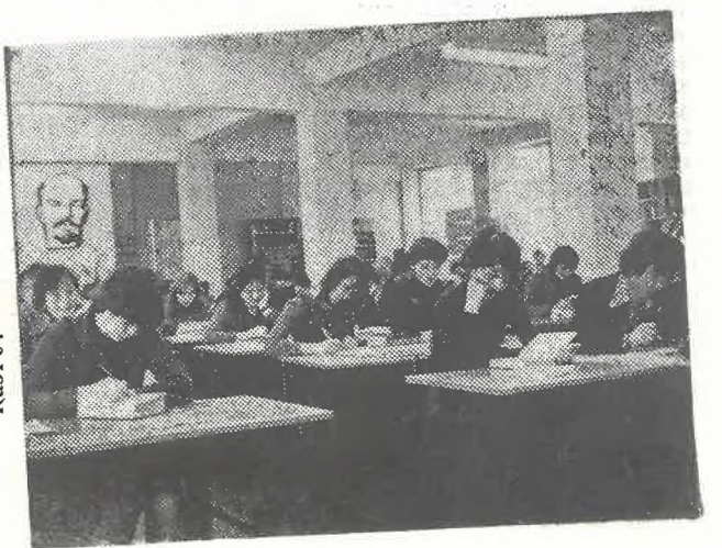
На снимке: Во время государственных экзаменов к услугам студентов читальный зал библиотеки КазГУ.