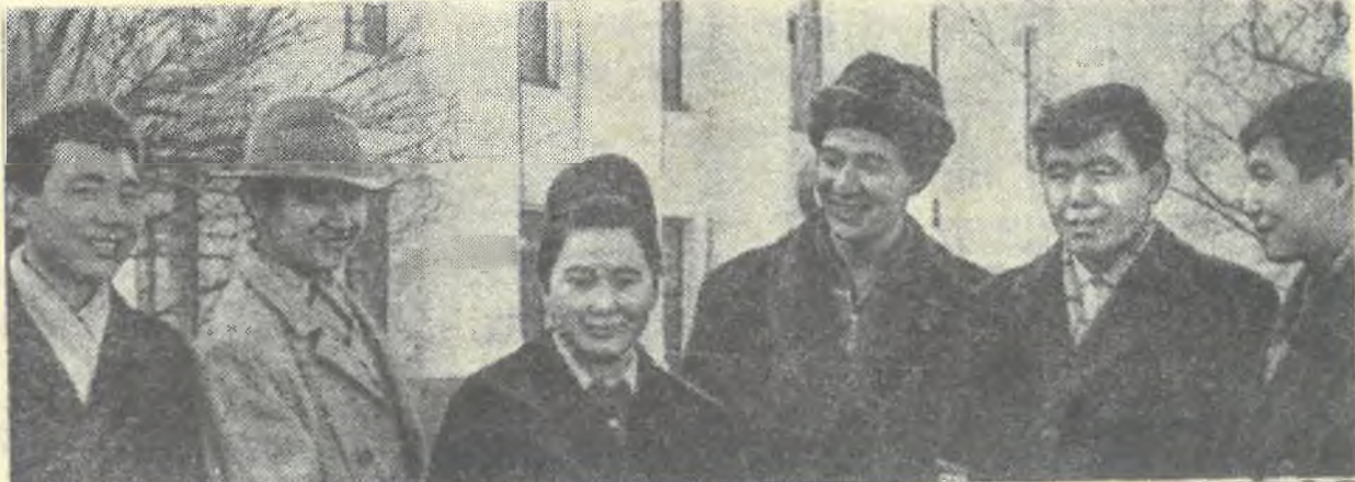
Редактор Г. КОЛОСОВ.