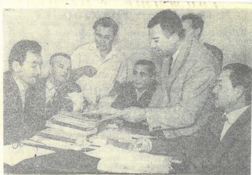
На снимке группа преподавателей университета знакомится с новой литературой.

Приближаются отчетно-выборное партийное собрание университета, комсомольская конференция. Надо сделать так, чтобы они прошли на высоком идейном уровне, в обстановке смелой критики и самокритики, чтобы убедительно указали нам всем на успехи и недостатки.