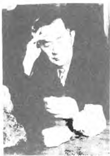
1. Қ.И. Сәтбаев болмағанда үлкен Жезқазған ашылар ма еді?..

Әрине, бұл күндері үлкен Жезқазған деп аталынатын Орталық Қазақстанның күрделі таулы-қазба кен орындарын апталар мен айларда ашу мүмкін емес еді. Ол үшін көптеген жылдар керек болатын. Себебі оның таулы жыныстарының күрделілігі өз алдына бөлсек те, Сарыарканың шөлді даласы, жазында аптапты ыстығы, қысында бет қаратпас боранымен үскірік аязы өзгеше және ең жақын деген темір жолдың өзі 400 километр қашықтықта болатын. Оның үстіне арнайы кәсіби мамандардың (барлаушы геологтар,